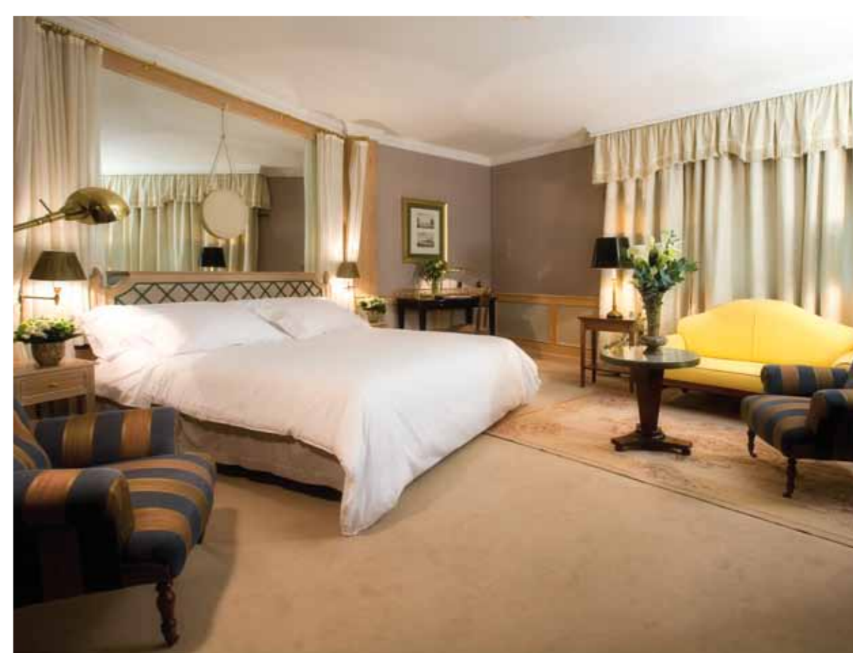
DORMITORIO SUITE / SUITE BEDROOM