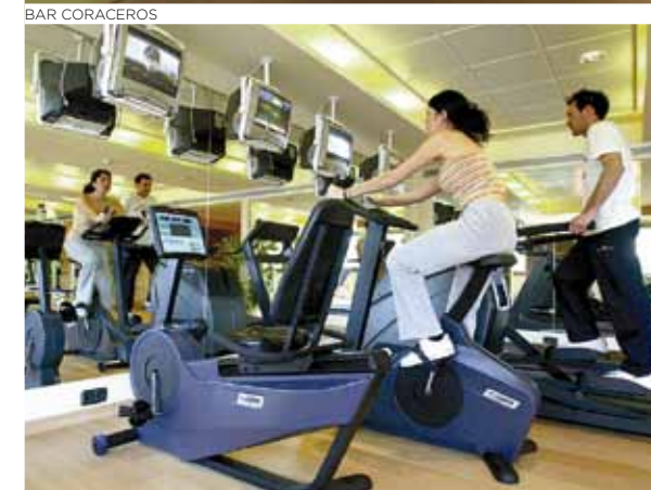
GINNASIO / GYMNASIUM