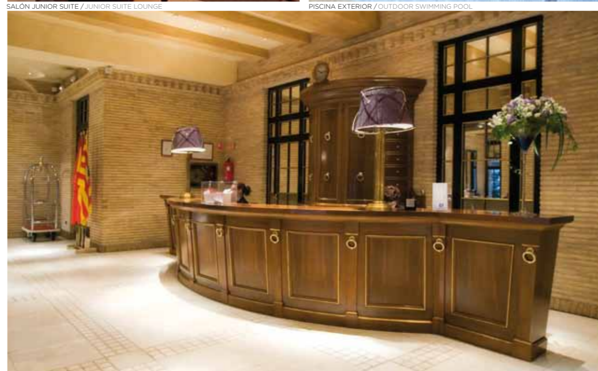
RECEPCIÓN / RECEPTION