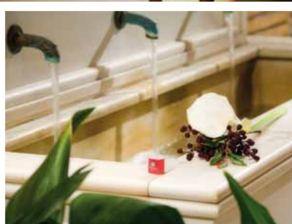
DETALLE HALL / HALL FEATURES