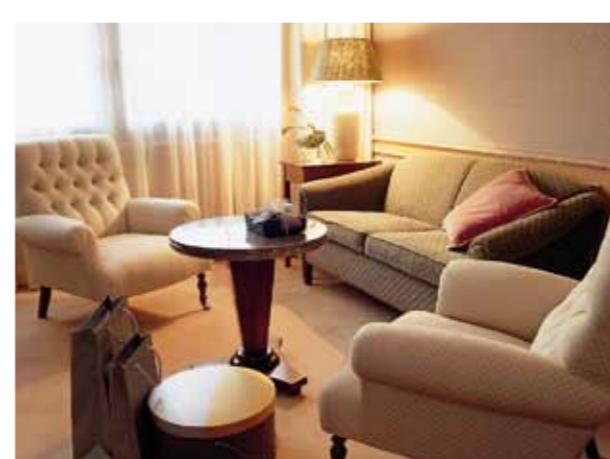
SALÓN JUNIOR SUITE / JUNIOR SUITE LOUNGE