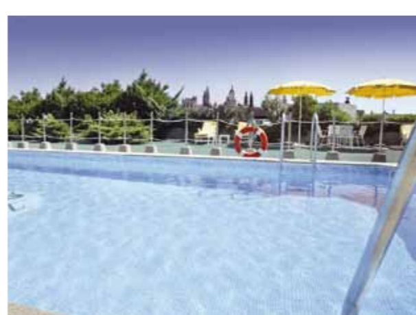
PISCINA EXTERIOR / OUTDOOR SWIMMING POOL