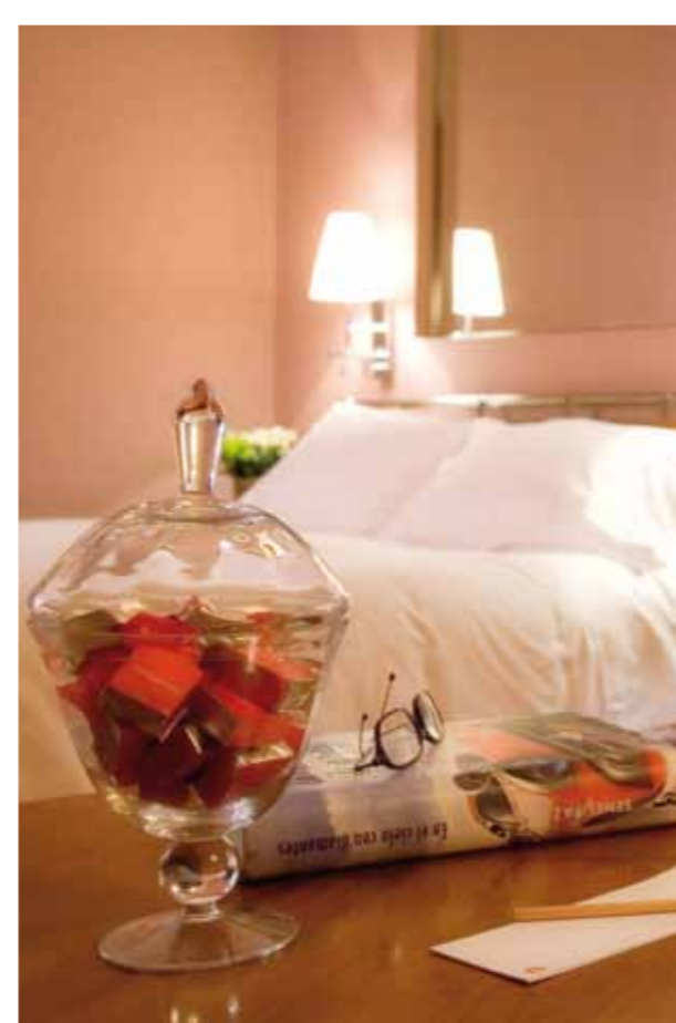
HABITACIÓN / STANDARD ROOM