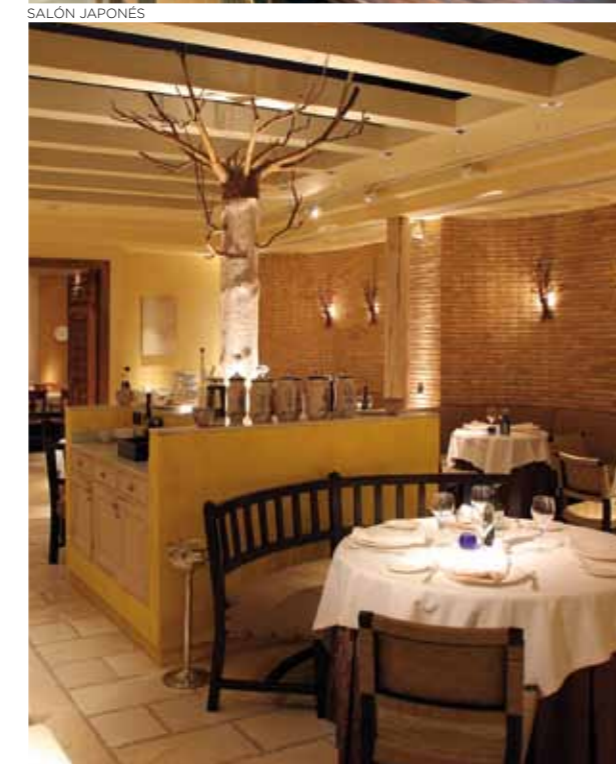
RESTAURANTE ARAGONIA PALAFOX