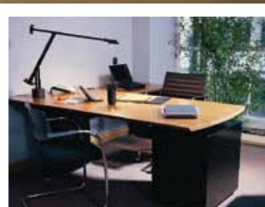
DESPACHO CENTRO DE NEGOCIOS / BUSINESS OFFICE