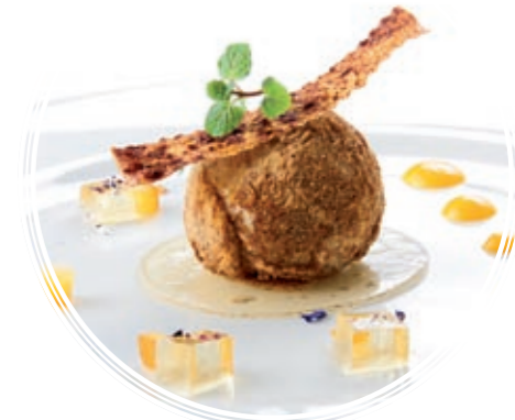
CREMA HELADA DE LECHE CON AZAHAR Y RON AÑEJO

E legid uno de nuestros menús según vuestro estilo, personalidad y gusto. Cada menú transmite la personalidad de un hotel, ¿cuál es el vuestro? Todos los menús incluyen aperitivo, decoración personalizada, recena y una bodega seleccionada por nuestros somelier. Además, compartid vuestra felicidad con los que más lo necesitan ya que donaremos el importe de la copa de sobremesa a la ONG que elijáis.