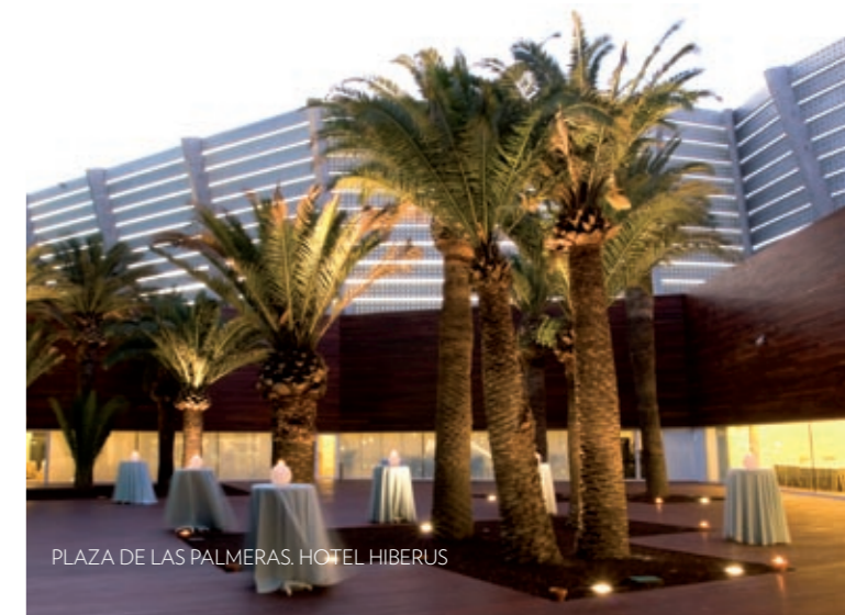
PLAZA DE LAS PALMERAS. HOTEL HIBERUS

Terrazas con palmeras, azoteas con vistas de la ciudad, salones de autor, escaleras de ensueño. Exteriores e interiores que sólo encontrarás en Palafox Hoteles para hacer vuestra boda a medida.