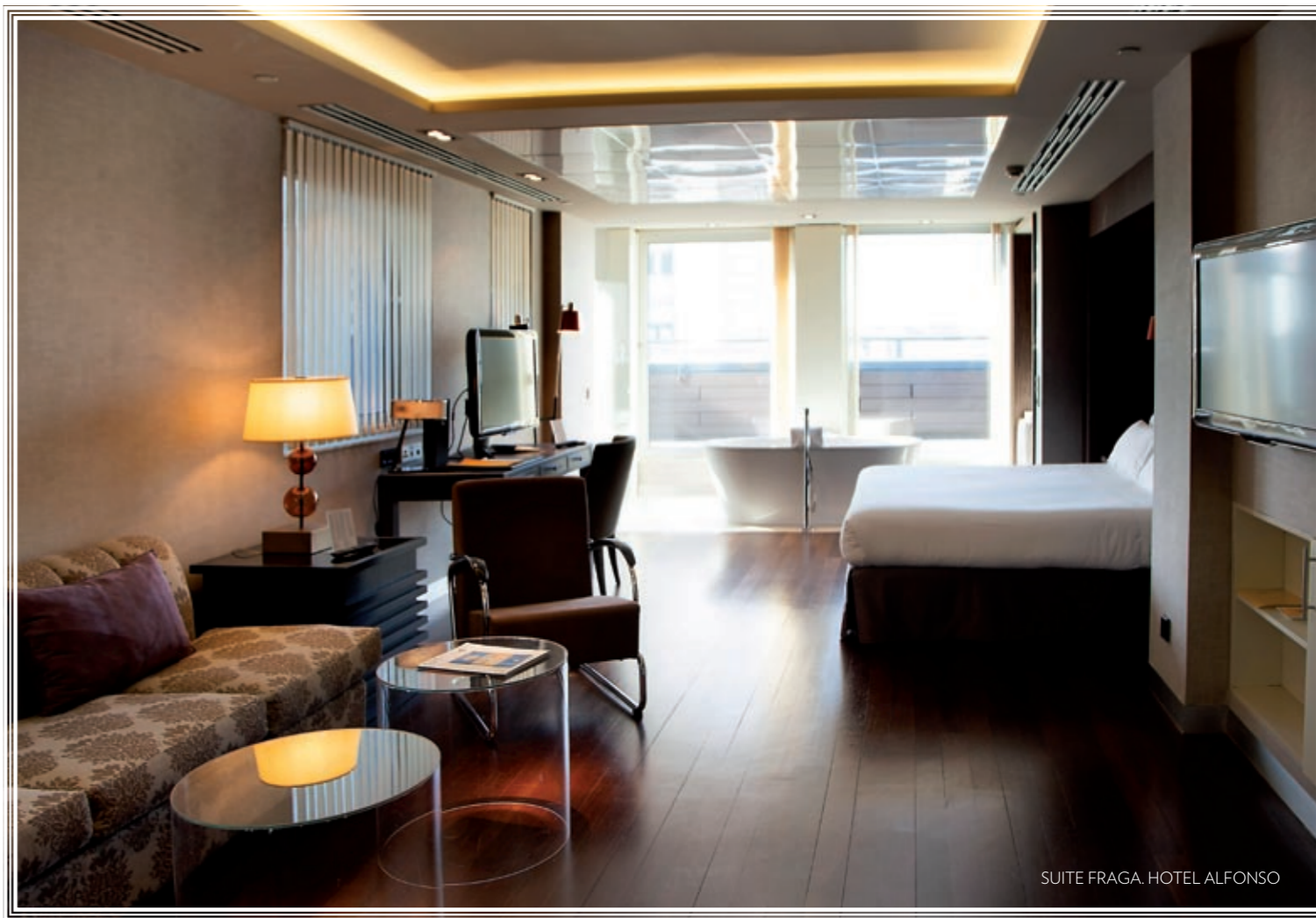
SUITE FRAGA. HOTEL ALFONSO