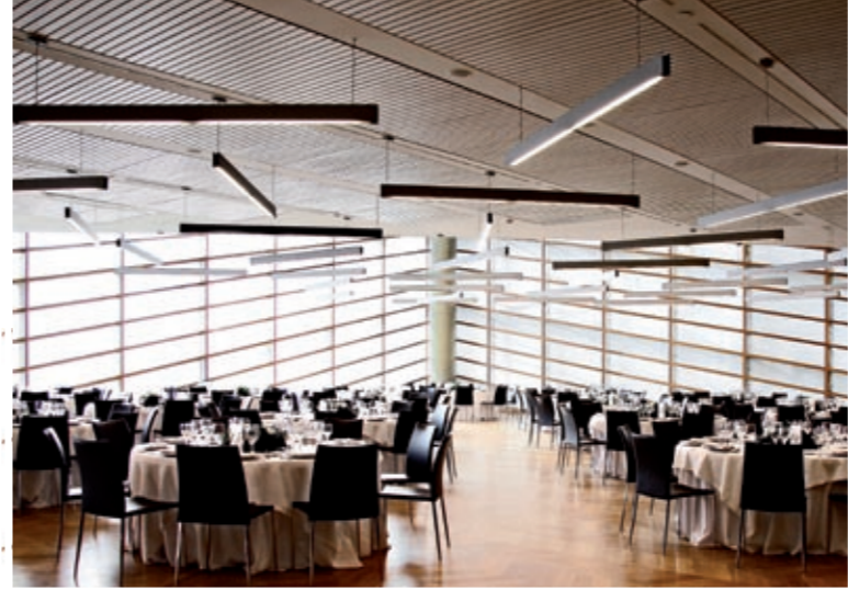
SALÓN INÉS DE POITIERS. HOTEL REINA PETRONILA

Una boda civil en la terraza del Ebro del Hotel Hiberus, un cóctel en la planta 12 del hotel Alfonso, un banquete en un salón decorado por el arquitecto Rafael Moneo en el Hotel Reina Petronila, una suite en el Hotel Palafox.