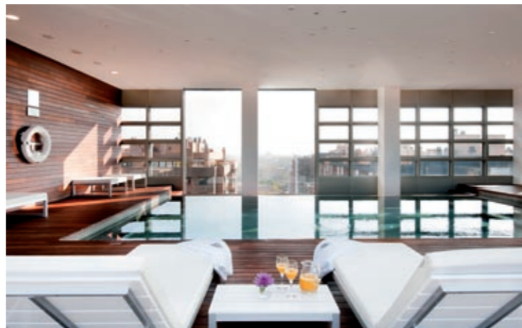
SPA HOTEL REINA PETRONILA

Una suite para hablar de la vida de los dos y del amor, como dice la canción. Un lugar privado donde podéis, disfrutar de un tratamiento de belleza, del spa... y prepararos para la boda.