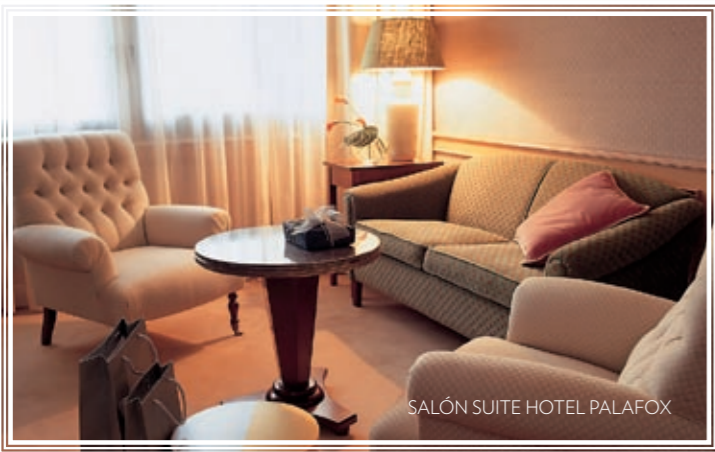
SALÓN SUITE HOTEL PALAFOX

Y PARA VUESTROS INVITADOS, CONDICIONES MUY ESPECIALES.