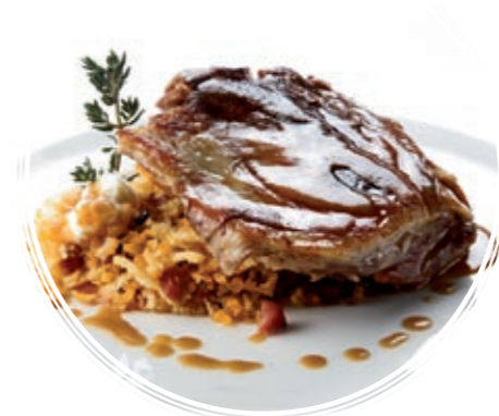
PALETILLA DE TERNASCO A BAJA TEMPERATURA CON MIGAS DE PASTOR