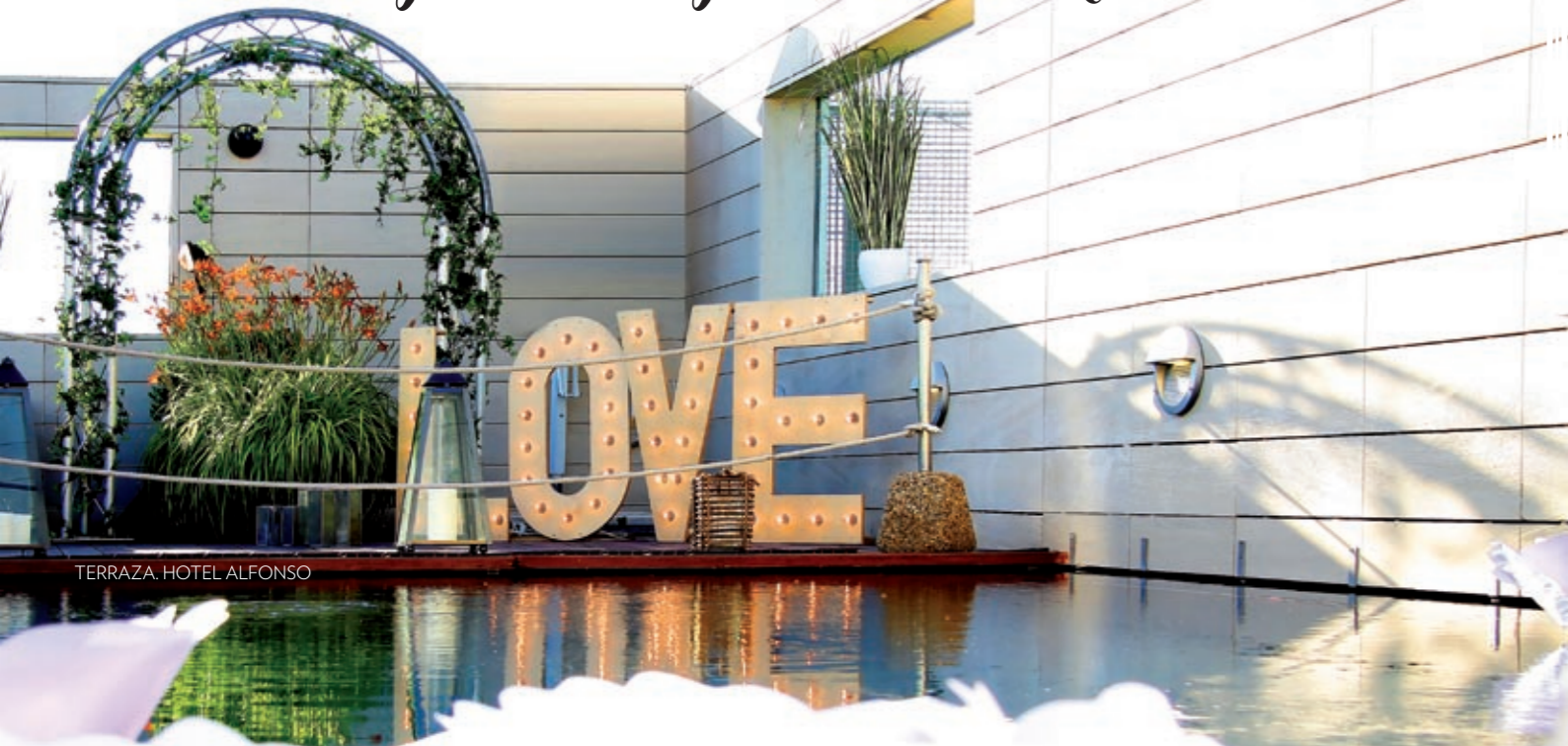
TERRAZA. HOTEL ALFONSO