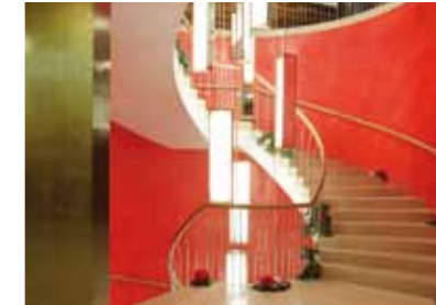
LÁMPARA ESCALERA / STAIR LIGHTING