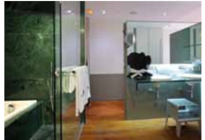
BAÑO HABITACIÓN / STANDARD ROOM BATHROOM