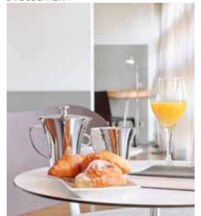
ROOM SERVICE 24H