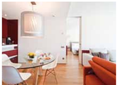
SALÓN SUITE / SUITE LOUNGE