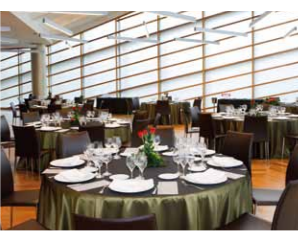
SALÓN INÉS DE POITIERS