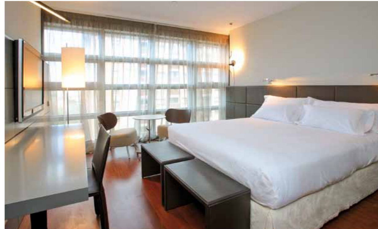
HABITACIÓN / STANDARD ROOM