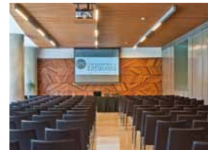
CRZ. CENTRO DE NEGOCIOS / BUSINESS CENTRE