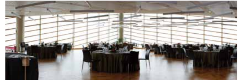
SALÓN INÉS DE POITIERS