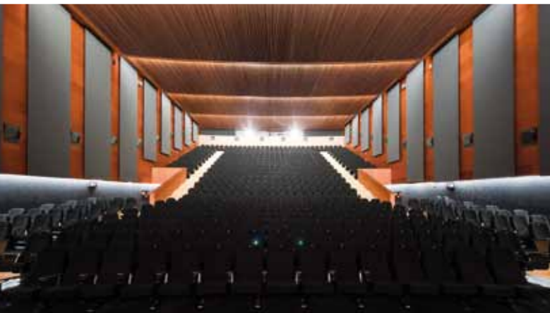
AUDITORIO CONDES DE BARCELONA / CONDES DE BARCELONA AUDITORIUM