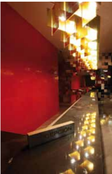
RECEPCIÓN / RECEPTION