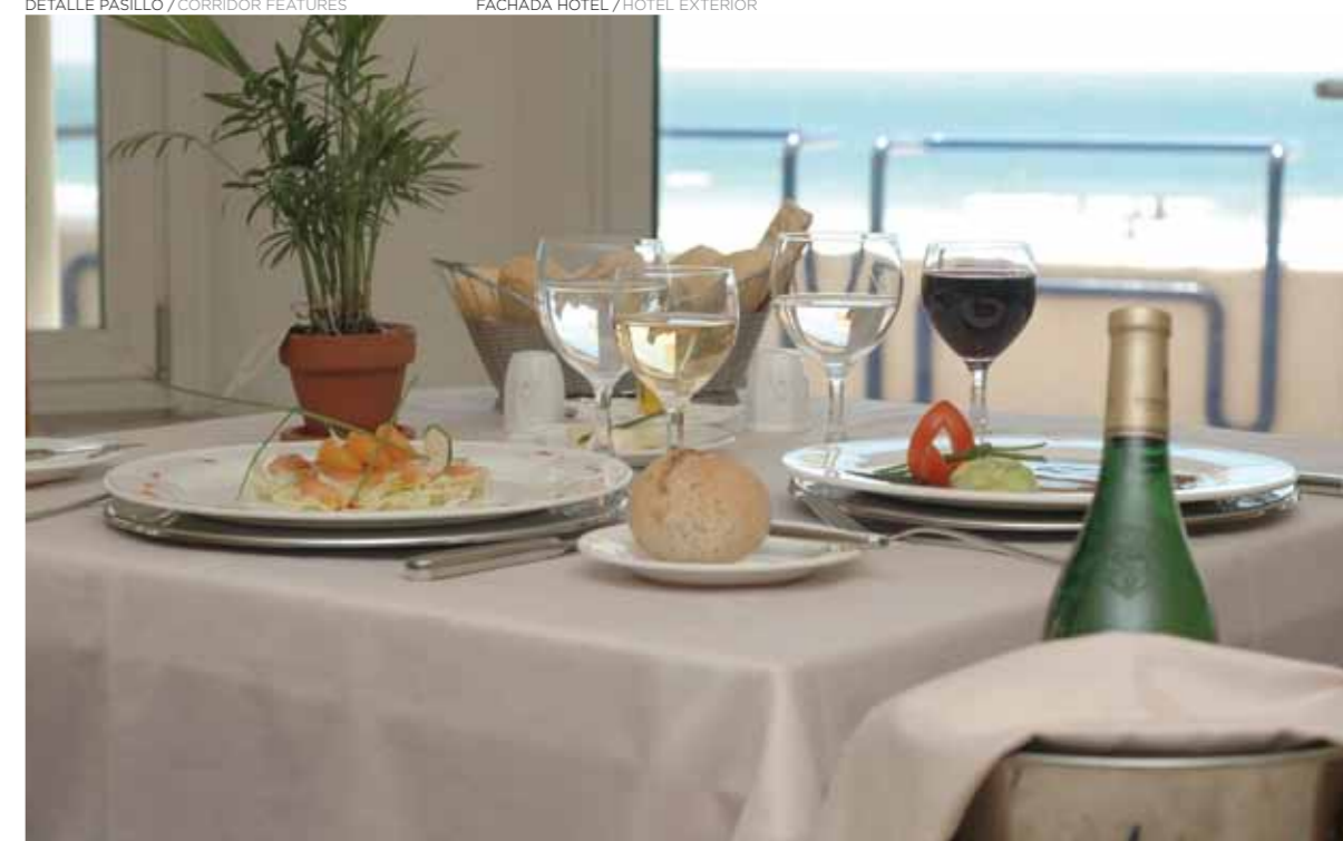
RESTAURANTE ISLA DE LEÓN