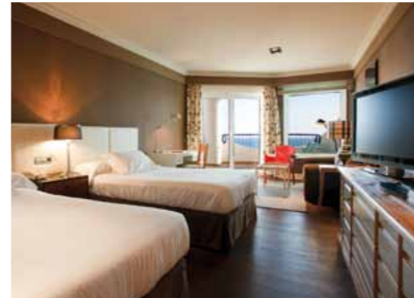
HABITACIÓN /TWIN ROOM