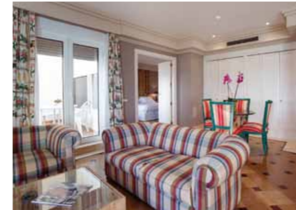
SALÓN SUITE /SUITE LOUNGE