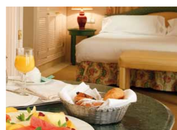
DETALLE SUITE /SUITE FEATURES