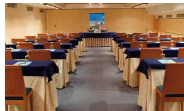
SALA DE REUNIONES / MEETING ROOM