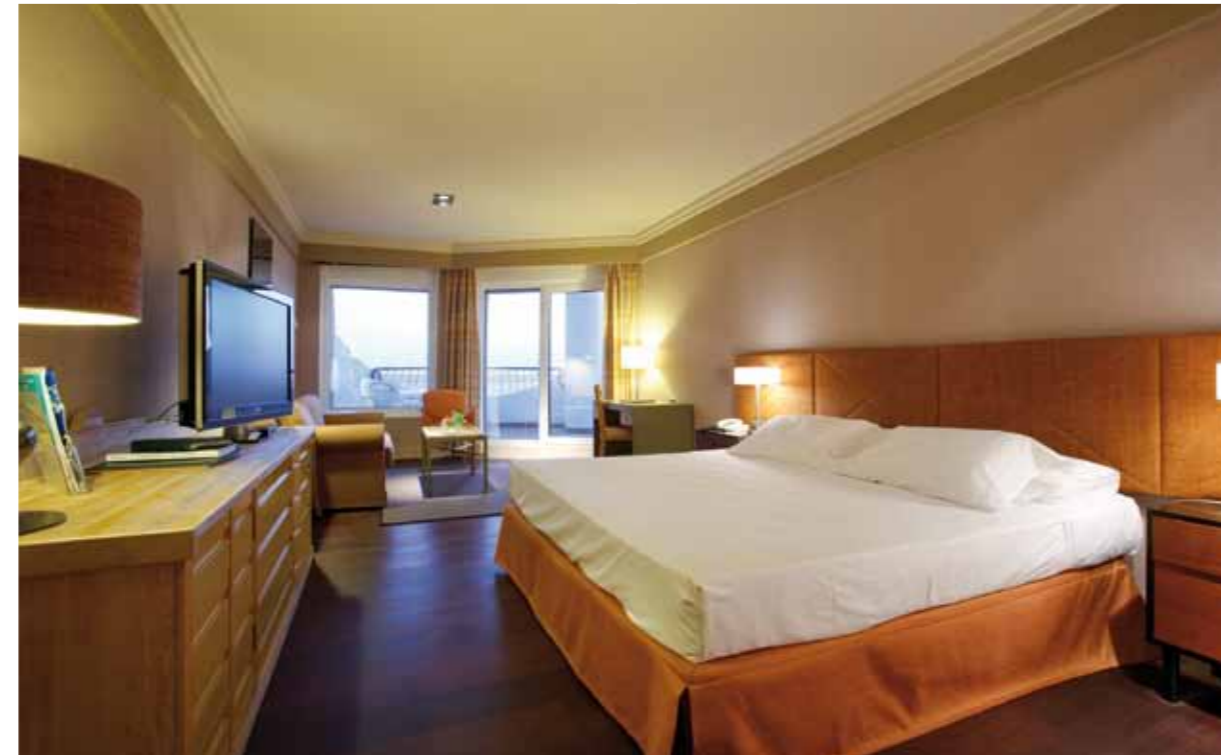
HABITACIÓN /STANDARD ROOM