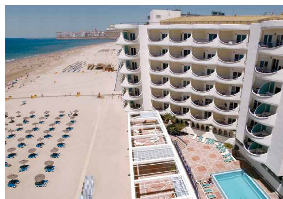
EXTERIOR HOTEL /HOTEL EXTERIOR