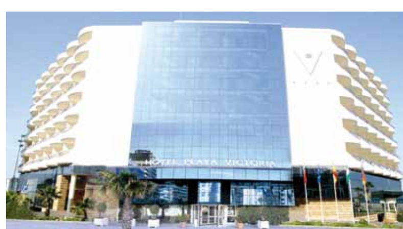
FACHADA HOTEL /HOTEL EXTERIOR