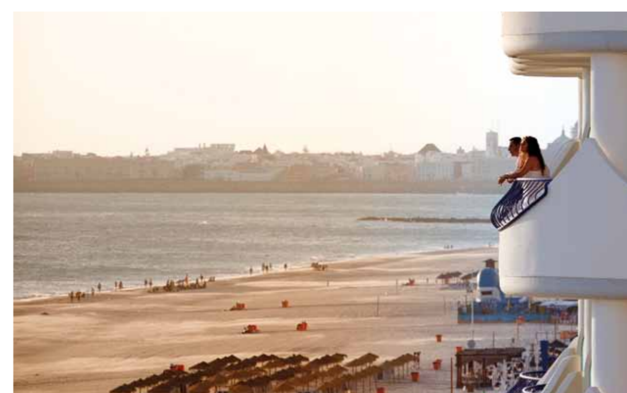
VISTAS DESDE LA HABITACIÓN /ROOM VIEW